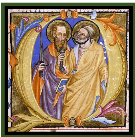
Martino de Bartolomeo, Santi Pietro e Paolo, miniatura, 1400, Coll. Priv.

«Chi non prende la croce non è degno di me. Chi accoglie voi, accoglie me»