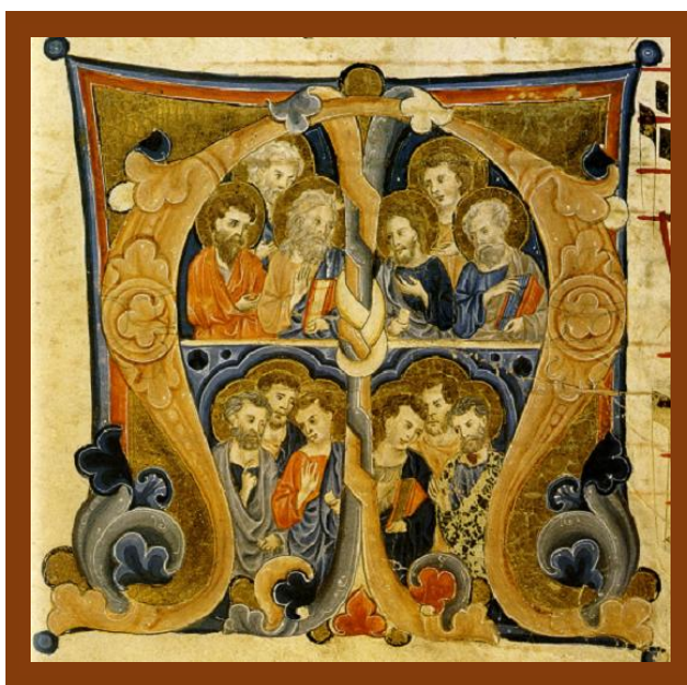
Vigoroso da Siena, Dodici apostoli, miniatura, XIII sec., Fondazione Cini, Venezia

14/6/2026 – 20/6/2026 XI SETTIMANA T.O. Anno A