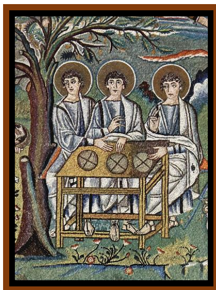
Trinità, Mosaico del Coro a San Vitale a Ravenna, ca. 475

31/5/2026 – 6/6/2026 SS.MA TRINITÀ – IX SETTIMANA T.O. - A Anno C