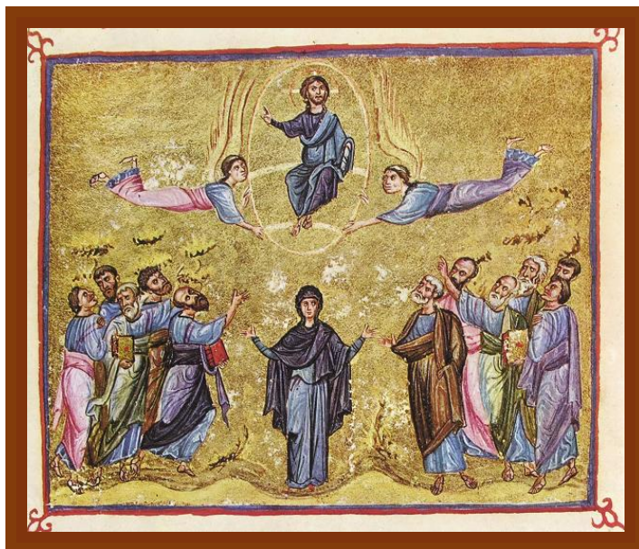
Ascensione di Cristo, miniatura su pergamena, XI secolo, Monastero Dionisiu, Monte Athos