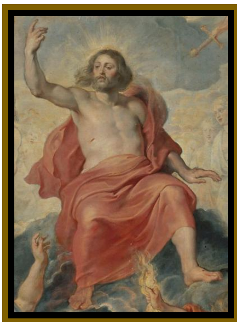
Peter Paul Rubens, Giudizio Universale, dettaglio, 1617, Alte Pinakothek, Monaco di Baviera (Germania)