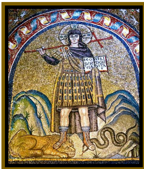
Cristo in trionfo mentre regge l'iscrizione in latino «Io sono la via, la verità, la vita», VI sec., Mosaico, Cappella Arcivescovile di Ravenna