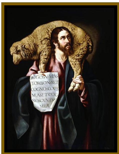
Cristóbal García Salmerón, Il Buon Pastore, XVII sec., Museo del Prado, Madrid