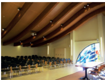
Salone incontri e convegni