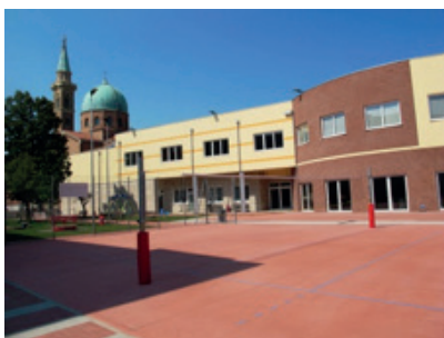
Il nuovo campo di pallavolo