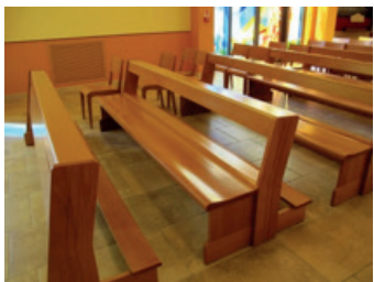
I banchi della nuova Cappella, in legno pregiato di faggio, della ditta Genuflex.